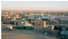
Imagen de los campamentos de refugiados saharauis

Sin embargo, cada vez es mayor el número de refugiados, en especial entre las jóvenes generaciones nacidas fuera de su tierra pero que mantienen su referente histórico y lingüístico y sus vínculos de hermandad con España siempre vivos, que presionan a la dirección del POLISARIO para volver a la guerra, forzados por el estancamiento de la situación, como ha reconocido el primer ministro de la RASD, Abdelkader Taleb Omar.